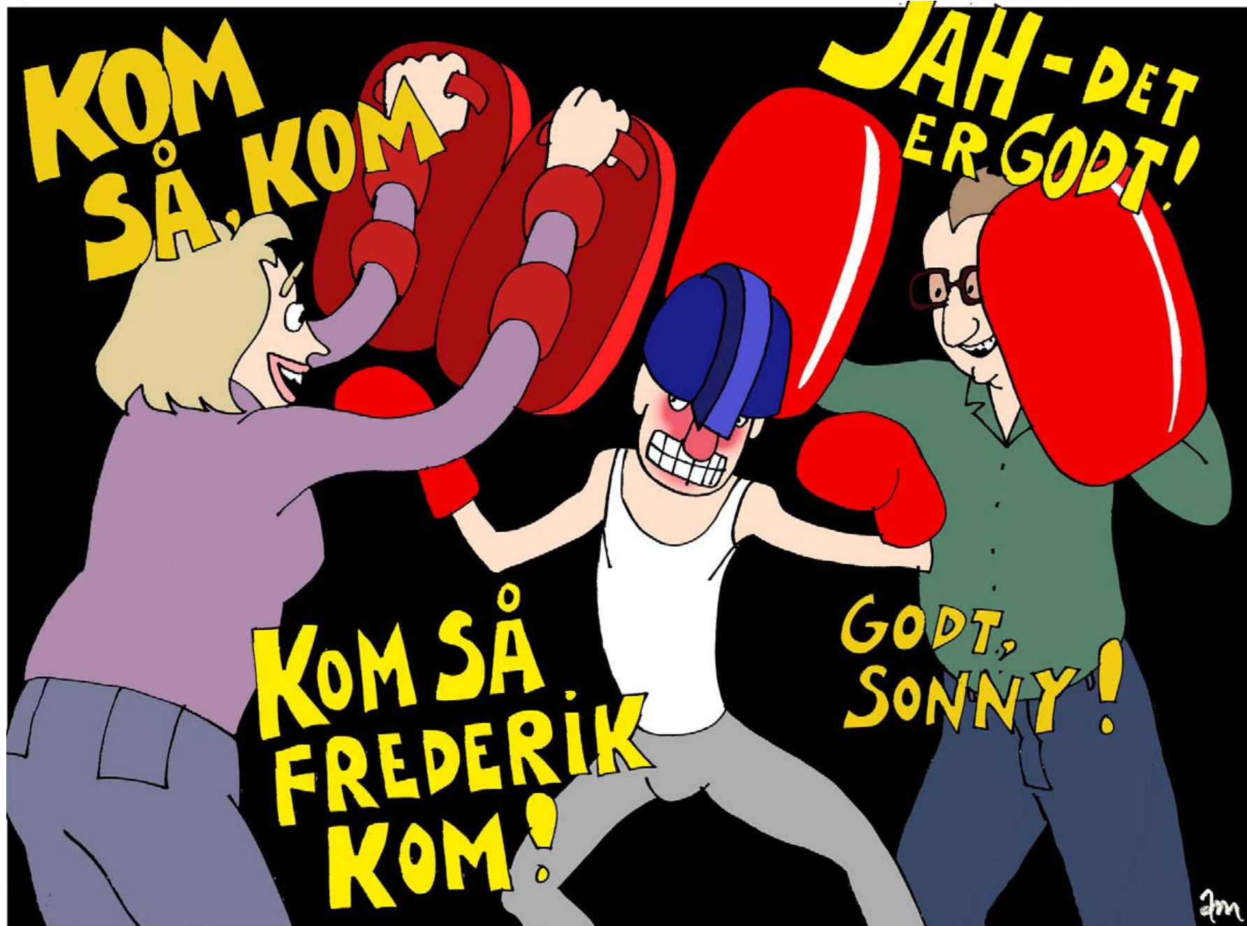
Tegning: Anne-Marie Steen Petersen

»Mange moderne forældre tror, at deres relation til børn skal være en 'jeg spørger - du svarer'-relation. Det er ikke ligeværdigt. Det er kun med til at demonstrere forældrenes magt over for barnet. Det havde forældre i gamle dage, men foræl-